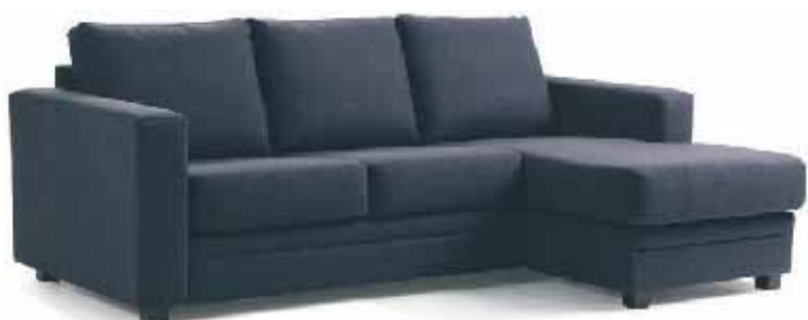
BREMEN 3-sits soffa med vändbar divan i tyg Nantes, i grått eller svart. L 214 cm D 92/140 cm.