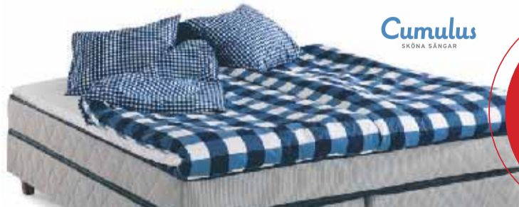
Cumulus SKÖNA SÅNGAR

CUMULUS K1200 KONTINENTAL-MADRASS INKLUSIVE BÄDDMADRASS B 9100, 8 ST STAR BEN H 10 CM PÅSLAKANSSET INGÅR EJ